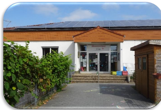
Eingangsbereich und „Fahrzeugstrecke“