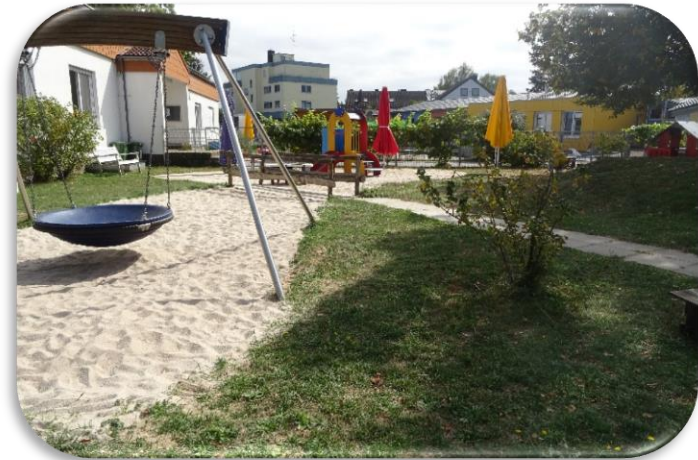
Der Garten: Bewegungs- und Erkundungsraum