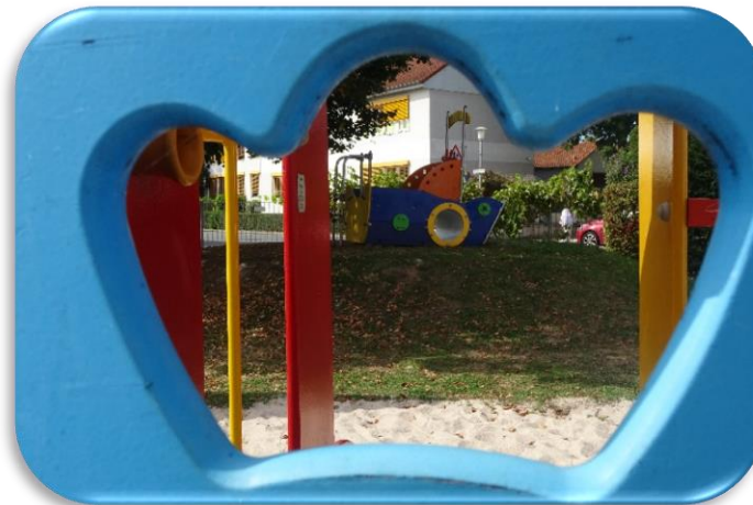
Der Garten aus Kleinkindperspektive